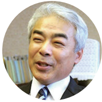
高橋 正樹氏 元富山県 高岡市長（3期）