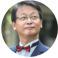
谷畑 英吾 元滋賀県 湖南市長（4期）